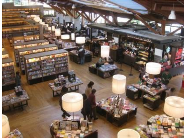
↑書店スペースのゆとりに比べ、↓図書館スペースの窮屈さが気になりました。