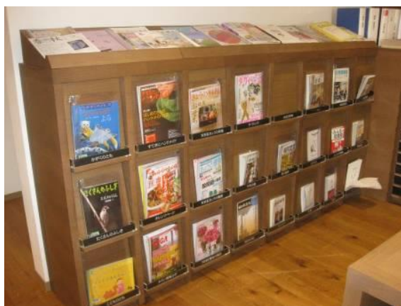
↑(雑誌は大人向きとこども向きが混在)

今までは児童室のすぐ近くにあったトイレも、水回りが近いという理由でスタバのものになったそうです。4か所あったトイレは入り口近くの1か所になり、子どもは遠くまで行かなくてはなりません。