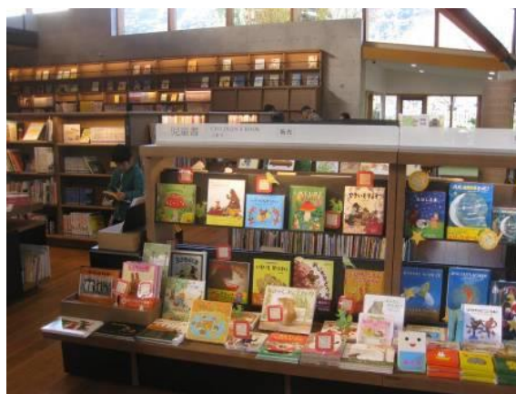
↑(これが書店の児童書の棚です。)

図書館のコーナーとの違いに愕然。図書館の本は、並べ方もひどいです。低学年からヤングアダルト向きまでが、ごちゃまぜに並んでいます。いっしょに見学した司書さんが「私には本を探すことができない。この図書館では働けない」と言ってました。この職員も大変だと思います。